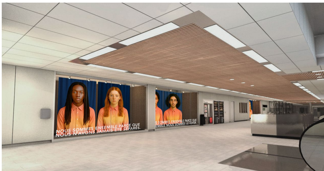
Maquette du project We Are Together Because... Pour la 18e Biennale de Lyon.