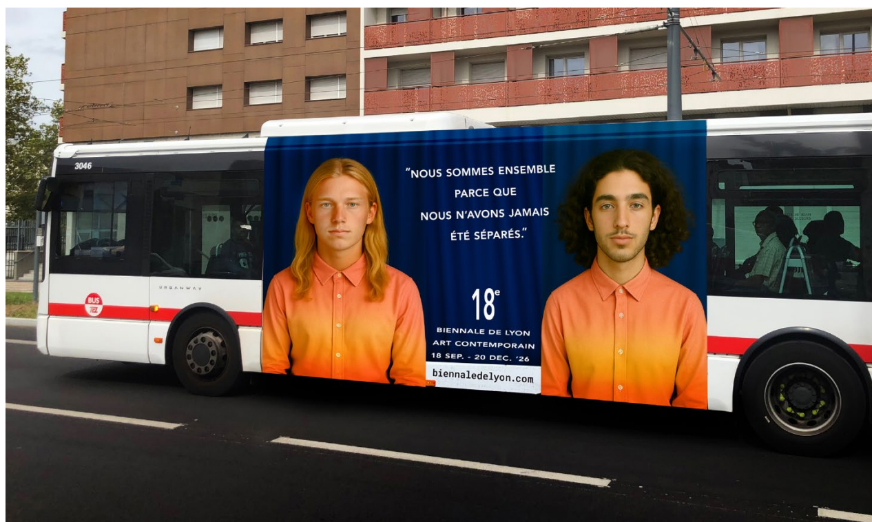
Maquette du project We Are Together Because... Pour la 18e Biennale de Lyon.